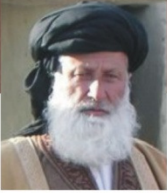
مولانا محمد خان شیرانی