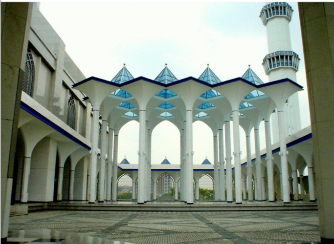
مہم سالانہ الدین کا اردو رتی حصہ

(ج) کیا میرے موجد/خالق کی جانب سے رہنمائی کے لئے ہدایات اور تربیت کے لئے نمونہ دکھانے اور نگرانی کرنے کے تربیت شدہ افراد مقرر ہوئے ہیں؟